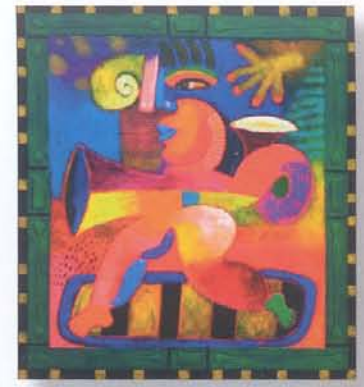
La vida es un carnaval